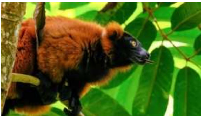
Roter Vari in der Masoala-Halle

Wir besuchten gemeinsam den Zoo Zürich. Wir sahen dort das im Jahr 2019 eröffnete Australienhaus mit den Koalas, die zur Familie der Kängurus gehörenden Bennett-Wallabys und die Emus, wie die afrikanischen Strausse Laufvögel und flugunfähig. Wir besuchten auch die im Jahr 2020 eröffnete Lewa Savanne, wo wir Giraffen, Nashörner, Zebras, Säbelantilopen und die Anlage für die Tüpfelhyänen sahen. Auch viele andere Tiere